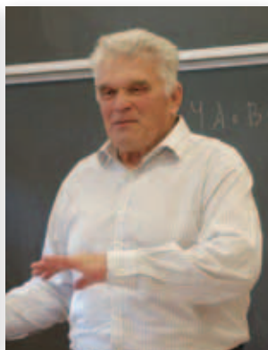
法捷耶夫 (維基百科)