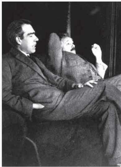
波耳（左）和愛因斯坦（右）。

愛因斯坦、包立、薛丁格、狄拉克來說，根本沒有用，而數理邏輯方面的進展，這些人更是不在意。物理學家所需要的數學，如矩陣、旋量（spinor）、佛克空間（Fock space）、狄拉克 \delta 函數、勞侖茲群表現（representation of Lorentz group）等，他們都自己「應變地首先或重新創造出來」。 我尤其注意到馬寧又說