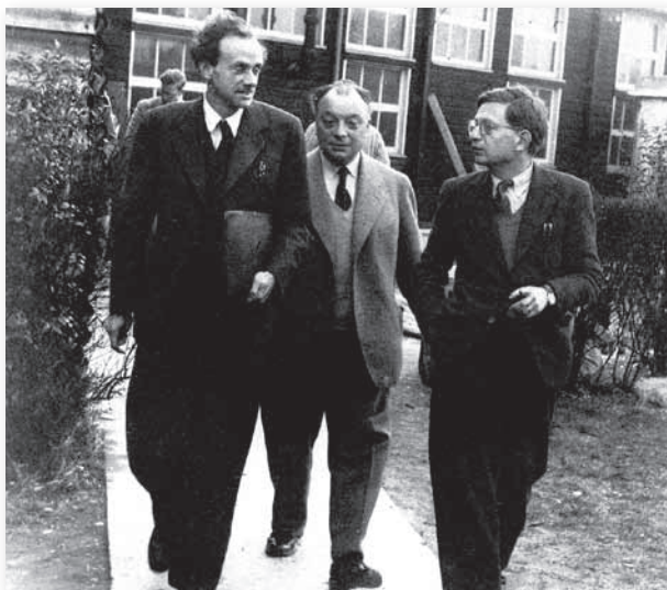
狄拉克（左），包立（中）攝於 1953 年。